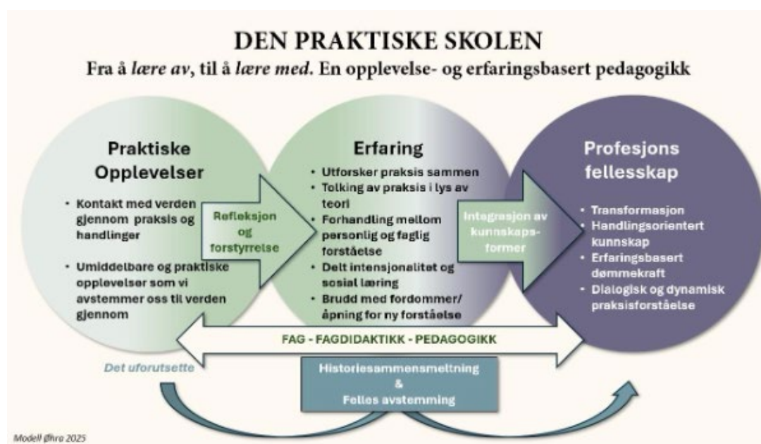
Figur 1 Den praktiske skolen

Piloten Lærerutdanning for den praktiske skolen ønsker å utforske en mer utforskende og praktisk tilnærming til læreryrket. Det legges opp til en fenomenologisk pedagogikk med større vekt på integrasjon av de ulike fagene, fagdidaktikk, pedagogikk og den praktiske skolehverdagen. I dette perspektivet legges det vekt på en opplevelse- og erfaringsbasert pedagogikk som vist i figur 1.