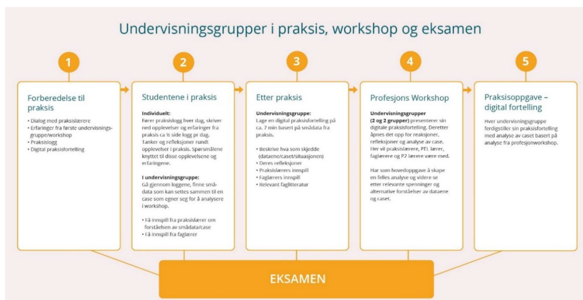
Figur 3 SFPU - modell

Sentralt i SFPU har vært å skape bedre sammenheng mellom lærerutdanningen og skolehverdagen. Prosjektet har utviklet nye praksiser og ny kunnskap om studentaktive undervisnings og vurderingsformer sentrert rundt studentenes egne opplevelser, erfaringer og refleksjoner fra praksis (smådata). Ved å legge mer vekt på studentenes egne opplevelser og erfaringer gis studentene større ansvar og tillit for å skape meningsfulle sammenhenger mellom teori og praksis samt mellom utdanningen og læreryrket. Som vi ser av figur 3.