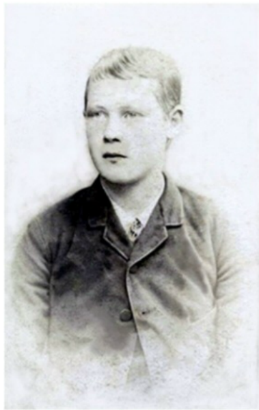
Førstereisgutt, 15 år gammel. CA 1910