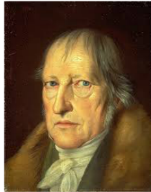
Georg Wilhelm Friedrich Hegel (1770-1831)

"Subjektets rett til særegenhet, til selvvirkeliggjøring, eller, hvilket er det samme, retten til subjektiv frihet, utgjør vende- og omdreiningspunktet i overgangen til den moderne verden" (G. W. F. Hegel, Grundlinien der Philosophie des Rechts. Frankfurt am Main: Suhrkamp 1970 [1821], 124)