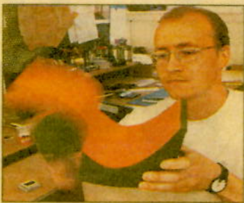
FERSKE FAG: Nye alternativer tilbys snart innen dyrepleie, dataspill, kjøreopplæring og møbeldesign.